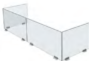
Fijos sobre mobiliario