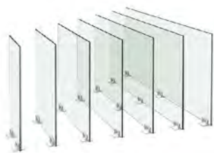
Fijos o desmontables